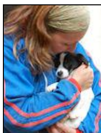
Espe ( Cehegin)